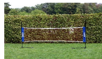
Beispiel-Abbildungen - Farben können abweichen