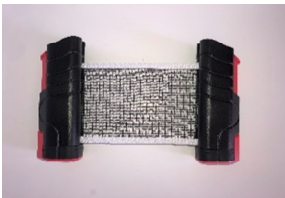
Beispiel-Abbildung - Farben können abweichen